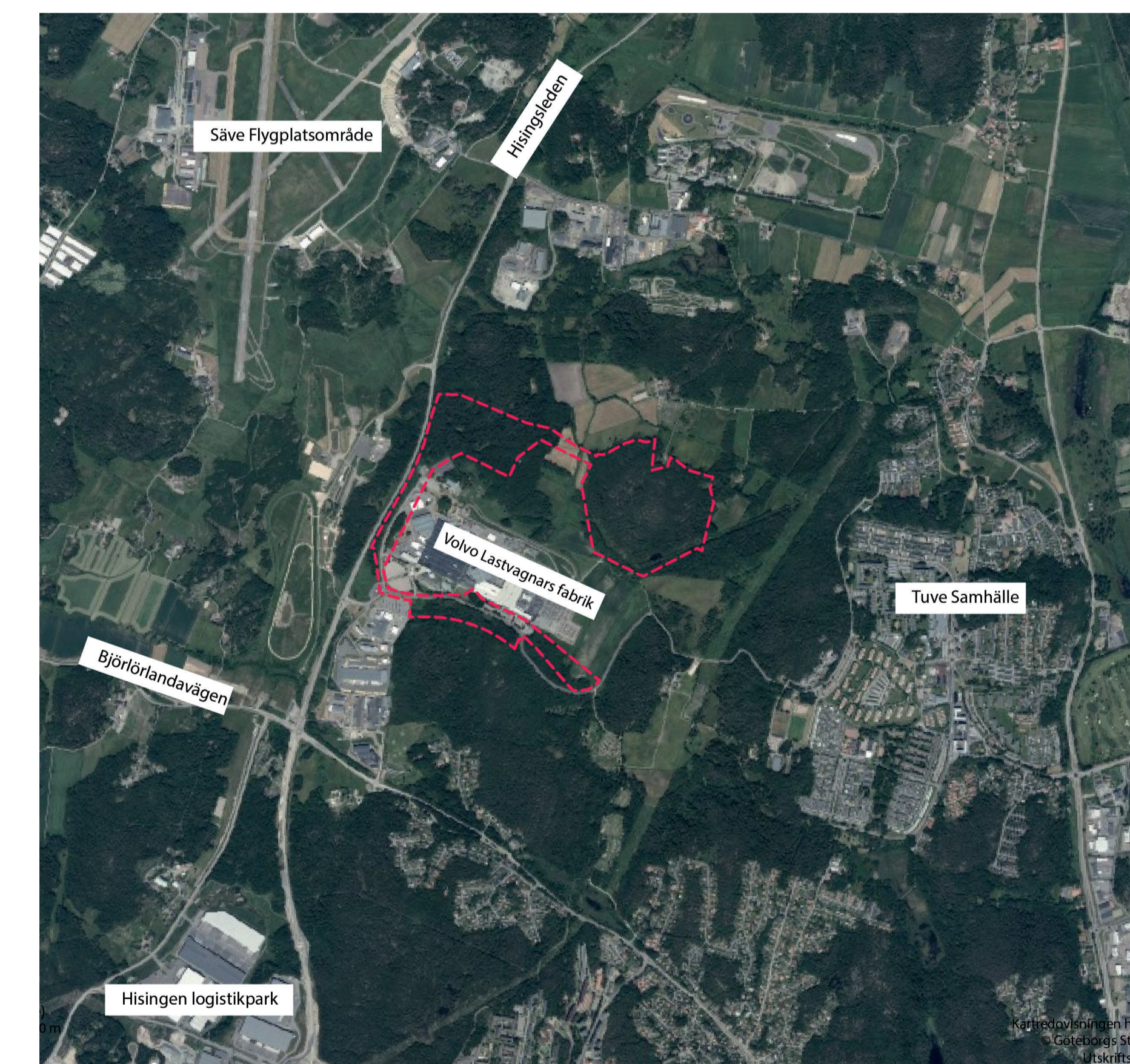
Röd markering visar planområdets placering i närområdet. Stadsbyggnadsförvaltningen, 2023.